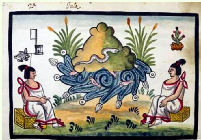
Esta imagen del Códice Tovar refiere al mítico Coatépetl, lugar de nacimiento de Huitzilopochtli.

(Texto leído en la presentación de Historia mexicana en el marco de la Feria Internacional del Libro de Coahuila, el 12 de mayo de 2026, en la sala Magdalena Mondragón del Centro de Convenciones de Torreón).